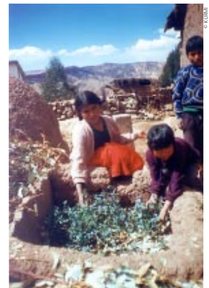
UN POTAGER PAR ÉCOLE En s'occupant de leur parcelle, les jeunes participent à la vie communautaire.

sion de faire passer les nouveaux savoirs à leurs concitoyens. Les premiers essais, très décevants, ont amené les responsables du projet à revoir leur stratégie. En effet, les nouveaux techniciens n'étaient pas pris au sérieux par les membres de leur propre communauté. La solution d'envoyer le personnel formé dans d'autres villages que les leurs s'est révélée être la bonne. Ces échanges entre membres de communautés différentes se sont avérés très enrichissants.