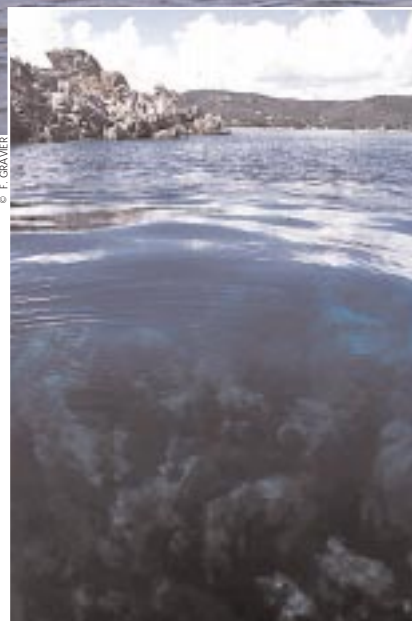
LES PÊCHEURS sont conscients qu'il est temps d'organiser le ramassage des déchets pour protéger les fonds marins.

Pour les vacanciers, les actions proposées dans le cadre de la campagne ont parfois représenté un loisir supplémentaire. Ainsi, durant une semaine, les initiations au trampoline et les descentes de tobogans du club de plage Le Pil'Ourse (St-Gilles-Croix-de-Vie, Vendée), ont été remplacées