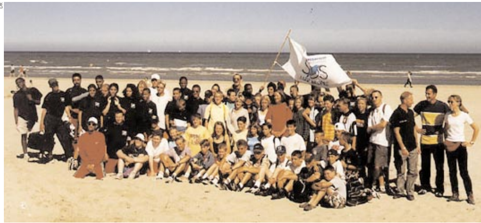
LES JEUNES PARISIENS venus à Dunkerque pour se confronter à la pollution sur le terrain et s'initier à l'environnement marin, sont décidés à revenir l'année prochaine pour former d'autres jeunes.