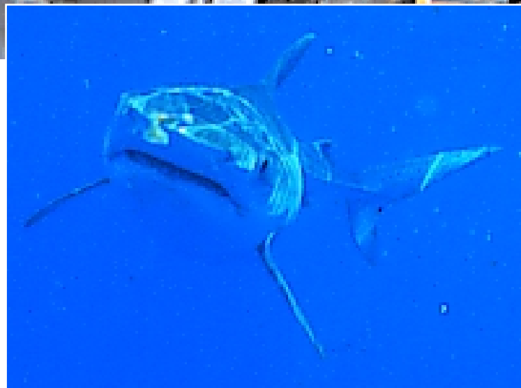
L'aérodynamisme du corps du requin lui permet d'atteindre des vitesses inégalées.

Les scientifiques observent d'abord minutieusement la nature. Ils constatent par exemple que les dauphins et les thons sont d'excellents nageurs qui peuvent atteindre des vitesses supérieures à 60 km/h, sans pour autant dépenser beaucoup d'énergie. Une partie de leur secret réside dans la forme allongée de leur corps, une forme