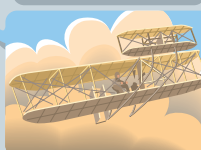
Avion à moteur à explosion Etats-Unis