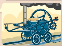
Locomotive à vapeur Grande-Bretagne