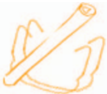
Poster + 2 crochets